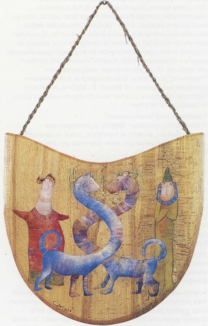
İki Kişi Birleştirme Muskası; gürgen üzerine akrilik, en 39 cm, 1998.

Ben iyi bir araştırmacıyım. "Yaratılış Efsaneleri" için de çok ayrıntılı bir araştırma yaptım. Türkler'e ait yaratılış efsaneleri Orta Asya'dan