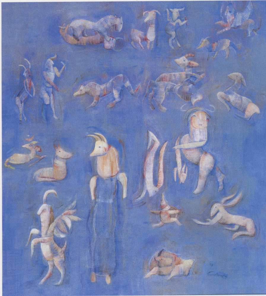
Av Muskası; tuval üzerine akrilik, 87x97 cm, 1998.