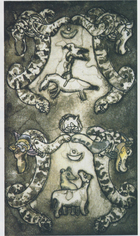
Yolculuk Muskası; gravür, 47x71 cm