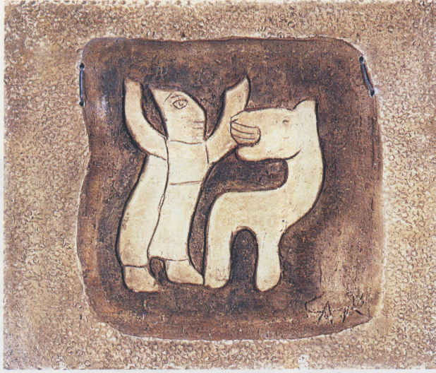
Kader Tableti; pişmiş toprak, 31x26 cm, 1998.