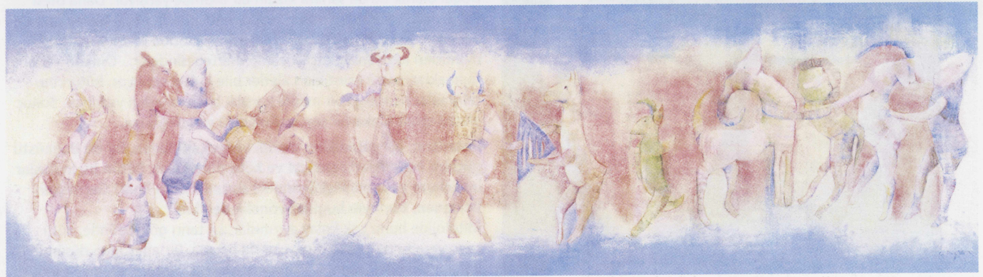
Kahramanlık Muskası; (antik muska: silindir mühür) tuval üzerine akrilik 195x55 cm, 1998.