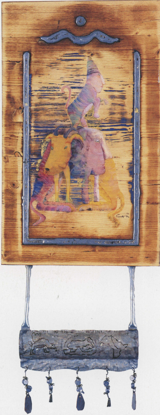
Cinlerden Korunma Muskası; ahşap üzerine kurşun, akrilik, altın varak ve çinko/bakır üzerine gravür, ahşap 30x50 cm, 1997.