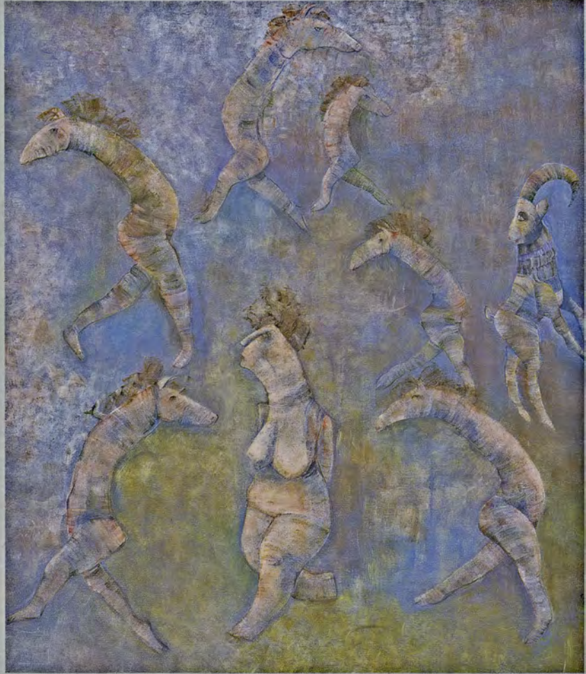
Güzel Soyma Muskası, 1997, tuval üzerine akrilik, 97 x 87 cm.

bazı dualar ve koruyucu tanrı isimleri de eklenmiştir. Sahibinin boynuna veya üstüne silindirin delik kısmından geçen kordon ile asılır ve koruyucu özelliğini sürdürür. Mühür olarak kullanıldığında iyelik yani sahip olmanın kanıtıdır. Sahibini,