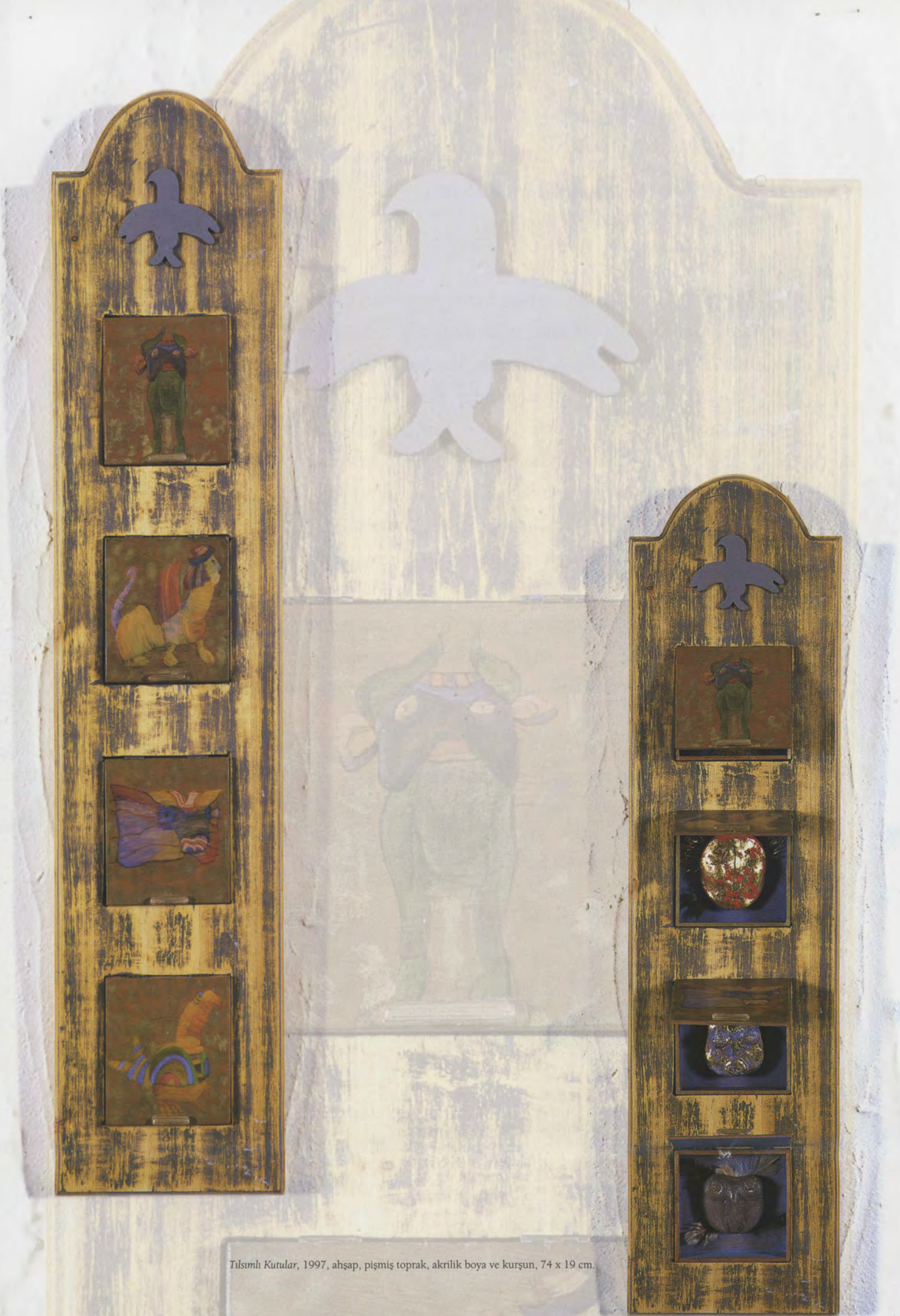
Tılsımlı Kutular, 1997, ahşap, pişmiş toprak, akrilik boya ve kurşun, 74 x 19 cm.