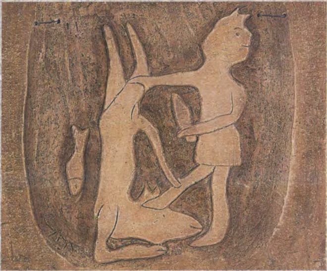
Kader Tabletleri, 1998, pişmiş toprak, 26 x 31 cm.