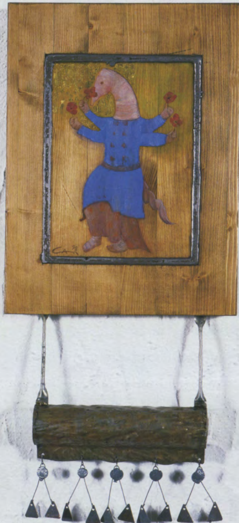
Muhabbet Muskasi , 1998, ahşap üzerine kurşun, akrilik boya, altın varak ve çinko/bakır üzerine gravür, 40 x 3x cm.