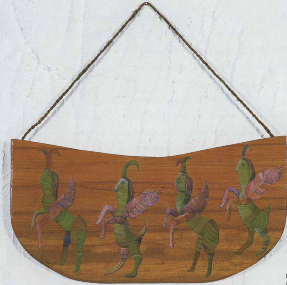
Deliligi Geçirme Muskasi , 1998, gürgen üzerine akrilik boya, en: 70 cm.