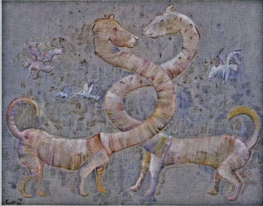
Kavuşma Muskası, 1998. tuval üzerine akrilik, 70 x 90 cm.