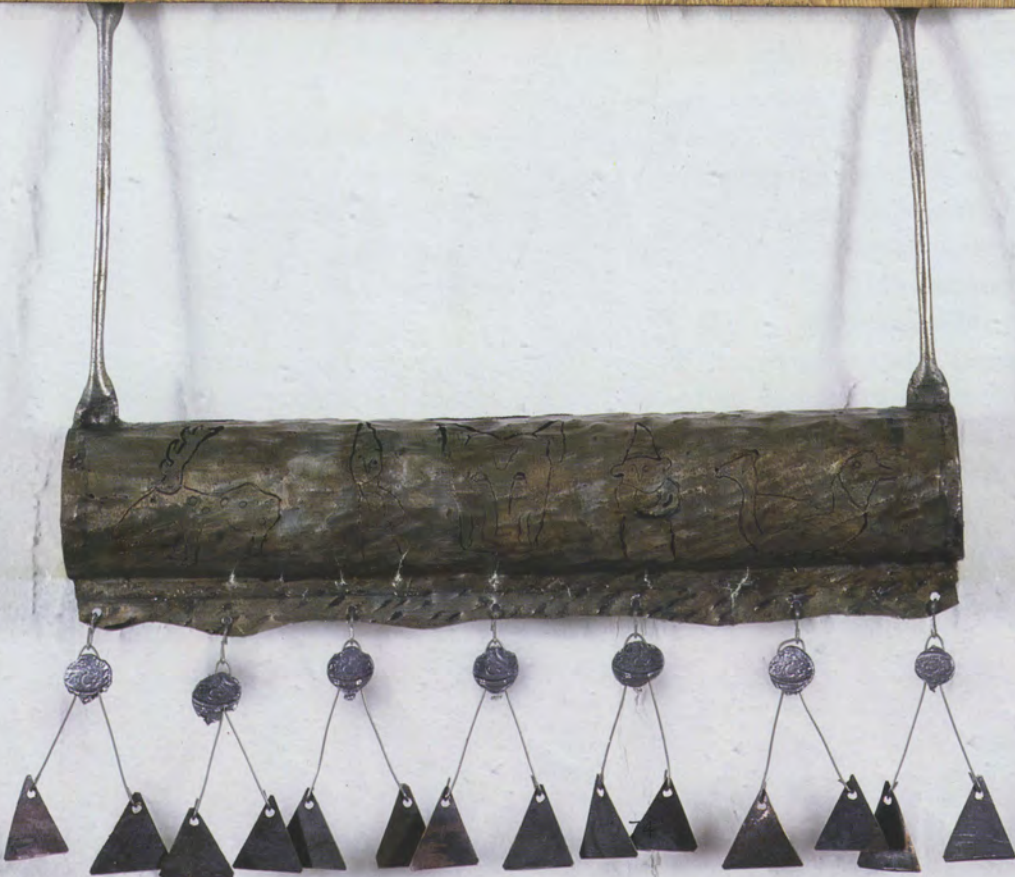
İki Kışiyi Ayırma Muskası, 1998, gürgen üzerine akrilik boya., en:37 cm.