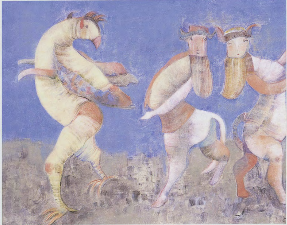
İktidar Muskası, 1998, tuval üzerine akrilik, 70 x 90 cm.

yaratıklarla dolu fantastik bir dünyada yaşamaya başladım. Nazarı bozan balık giysili su tanrılarını, deliliğı önleyen bastıracak yeşil adamları, yel ve sel getiren başı taçlı köpeğı, güzelleri soyan cinleri, ayrılıkları gideren uzun boyunlu yaratıkları, yemişleri olduran, ineklerin sütünü bollaştıran güçleri anlamaya çalıştım. 1924-26 kazılarında Ur'da bulunan, evlerin temellerine veya duvarlarına gömülen, içlerinde koruyucu hayvan heykelcikleri taşıyan tılsımlı kutuların çağdaş