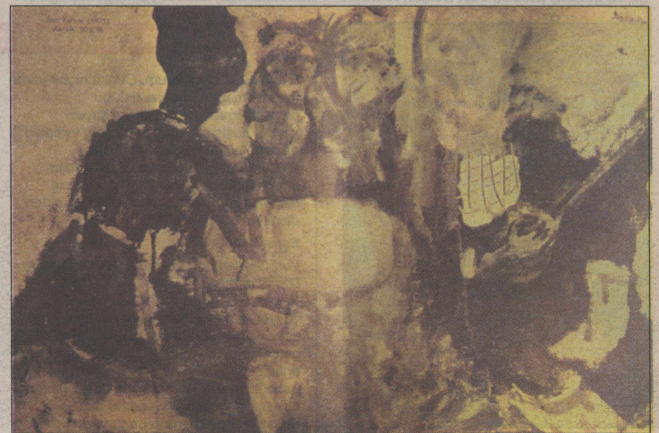
"Sarı Kahve", 1975.