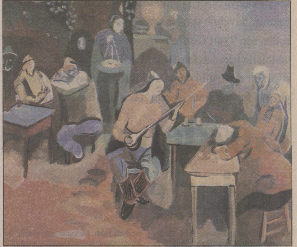
"Çorum Kahveleri", tarihsiz.

Bedri Rahmi fotoğrafı Ara Güler'in "Bir Devir Böyle Geçti Kalanlara Selam Olsun" kitabından alındı.