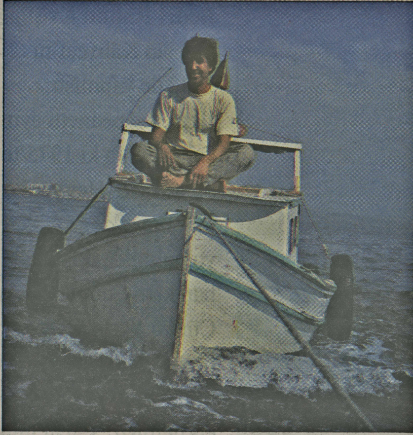
İbrahim Reis: "Padişah dilencilik azalsın diye icat etmiş balıkçılığı..."