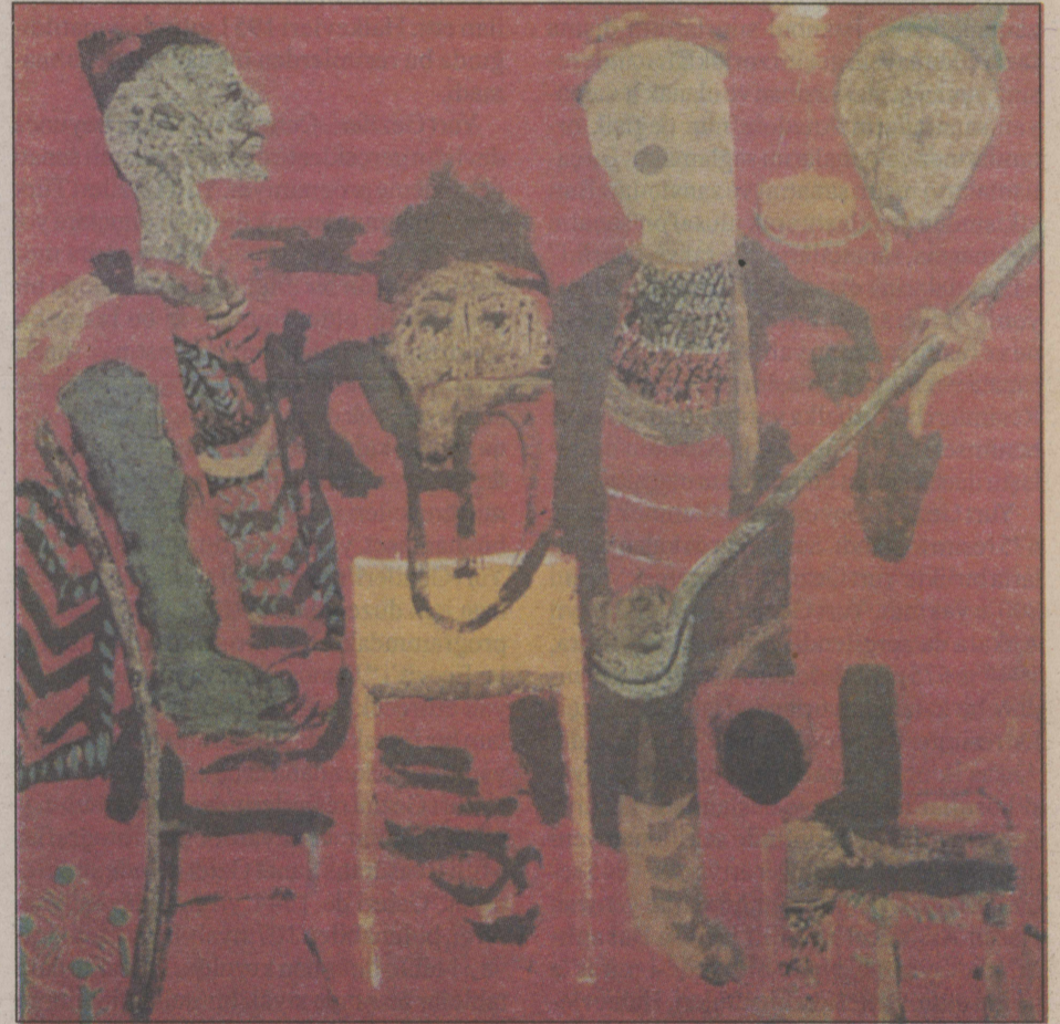
"Kırmızı Kahve", 1974.