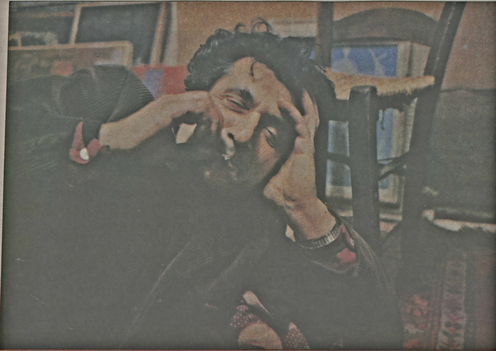
Çorum, Bedri Rahmi Eyüboğlu'nun yaşamında ve sanatında bir dönüm noktası olmuştu.

Kaptan da vardı. Kaptan'a göre Tunca, Arda kıyılarında, çoğu kez öğlen yemeklerini unutarak, "güneş ateşten bir tepsiye dönene kadar" çalışmışlardı. Bedri Rahmi, bir ay kaldığı Edirne'den döndükten sonra izlenimlerini, "Edirne'de İstanbul'a hiç benzemeyen bir yönü gösterecek renk ve çizgileri bul-