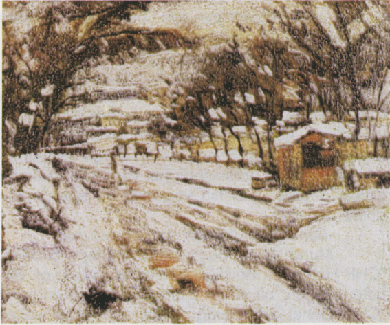
Eşref Üren "Ağrı"

Murat Ural: Bu yönde bir bilgiye rastlamadık. Gitmem demek herhalde zor olmalıdır. Çünkü bu, Cumhuriyet'in verdiği bir görev. O günlerde Cumhuriyet heyecanının henüz kaybolmadığını düşünmek gerekir. Ancak gitmek istemeyen bir kişi herhalde bir mazeret bulabilirdi. Ancak böyle bir örneğe rastlamadık. Basında yer alan haberler ve sanatçıların yazdıklarına göre geziler, ressamlar arasında ilgiyle karşılanmış. Zaten önemli bir kısmı açık hava ressamıdır. Gezileri daha isteksizce karşılayacak olanların, o sıralarda modern resim anlayışlarını savunan daha çok atölye çalışması yapan sanatçılar, örneğin D Grubu'nun sanatçıları olabile-