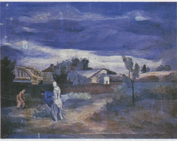
Cemal Tollu "Antalya Ziraat İstasyonu" (Solda)