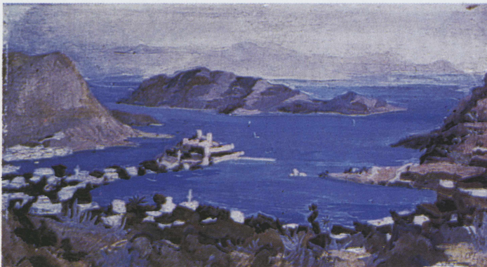
Zeki Kocamenni (1938) "Rize'de Küçük Çay Ziraatı" (Sağda)