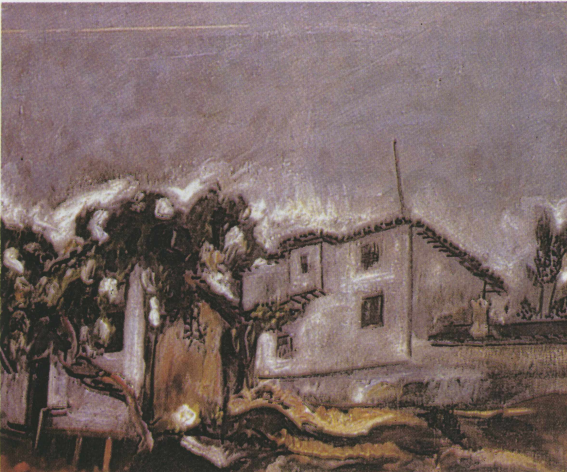
Bedri Rahmi "Edirne Muradiye' de Kahve"

ceği akla gelir. Ancak onların da hemen hepsi bu gezilere, hatta bazıları iki defa katılmışlardır. İlginçtir ki sonuçta bu gezilerin, zaten açık havada çalışan peyzaj ressamlarından daha çok bu ikinci grup üzerinde etkili olduğu ileri sürülebilir.