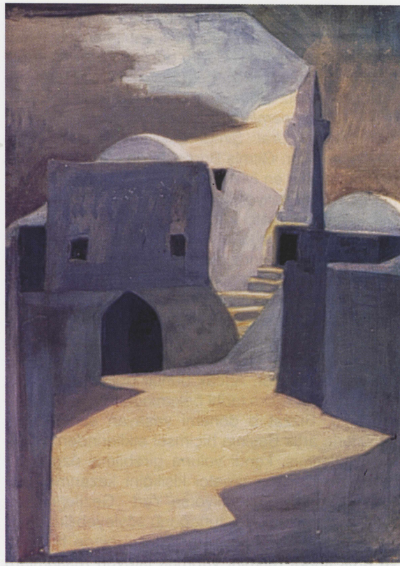
Halil Dikmen (1943) "Tillo Köyü Siirt" (Sağda)

min yeni Maarif Bakanı Reşat Şemsettin Sırer tarafından çok da ilgiyle karşılanmaz. Bu, dönemin noktası olur ve resimler kaderlerine terk edilir. Eğer bu olmasaydı, resimlerin önemli kısmı müzeye geçebilir, bugüne kalabilirdi. Sonra resimler oradan oraya taşınıyor. En sonunda Halkevleri'nin çatı altında yağmur, rutubet, toz-toprak ve farelere terk ediliyor. Bu arada önemli bir kısmı ciddi olarak tahrip oluyor. Bunu, resimleri 1947-1948 yıllarında gören Bedri Rahmi'nin tanıklığından biliyoruz. 1950 yılında iktidar değişiyor ve 1951 yılında Halkevleri kapatılıyor. Bundan sonra resimlerden haber alınmıyor. Malik Aksel'in anlattığına göre "kapanın elinde kalıyor" ve harap durumda olanlar da çok kuvvetli bir olasılıkla çöpe atılıyor veya yırtılıp yakılarak yok ediliyor. Bu olay, Türkiye sanat ve kültür tarihinde görülen en büyük yağma ve yok etme hareketidir. Kuşkusuz bu dönemde yok edilenler sadece Yurt Gezisi resimleri değil. Eğer araştırılırsa bu yok ediciliğin boyutlarının tahmin edilebileceklerin de çok ötesinde olduğu görülecek.