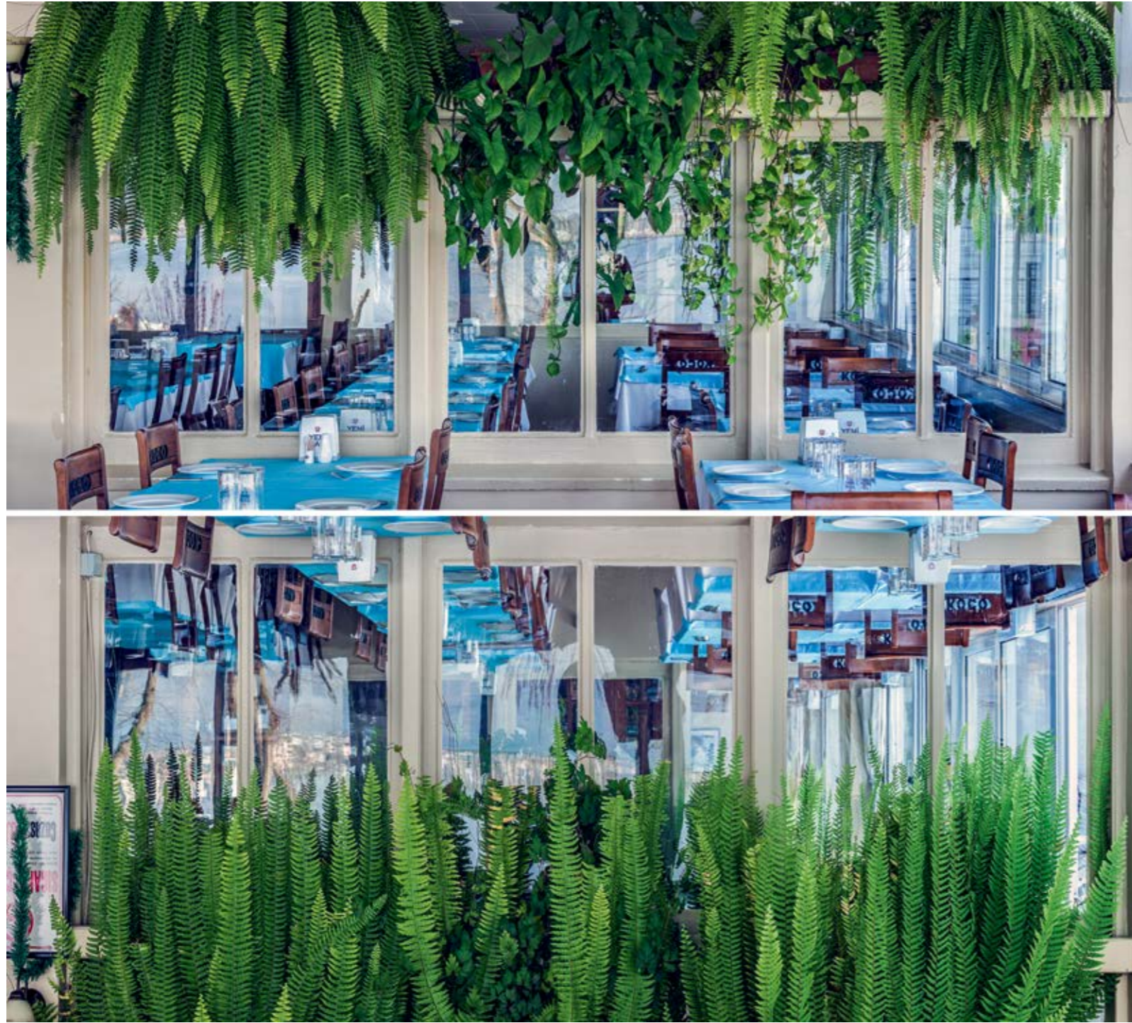
Murat Germen C - Print, 108.7x120 cm, 2012