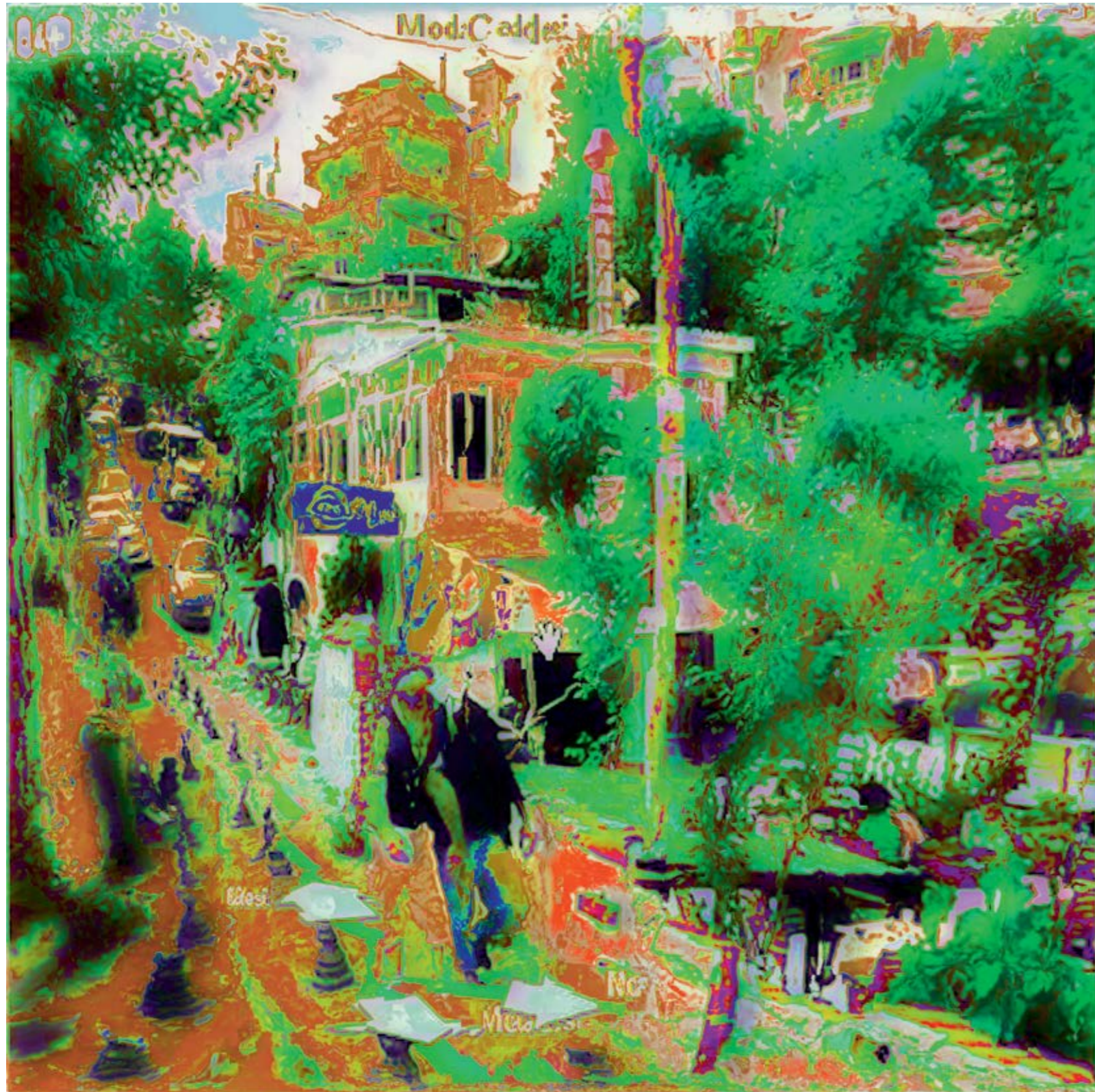
Orhan Cem Çetin "Koço Çevrimiçi", "Koco Online", C-Print, 100x100 cm, 2012