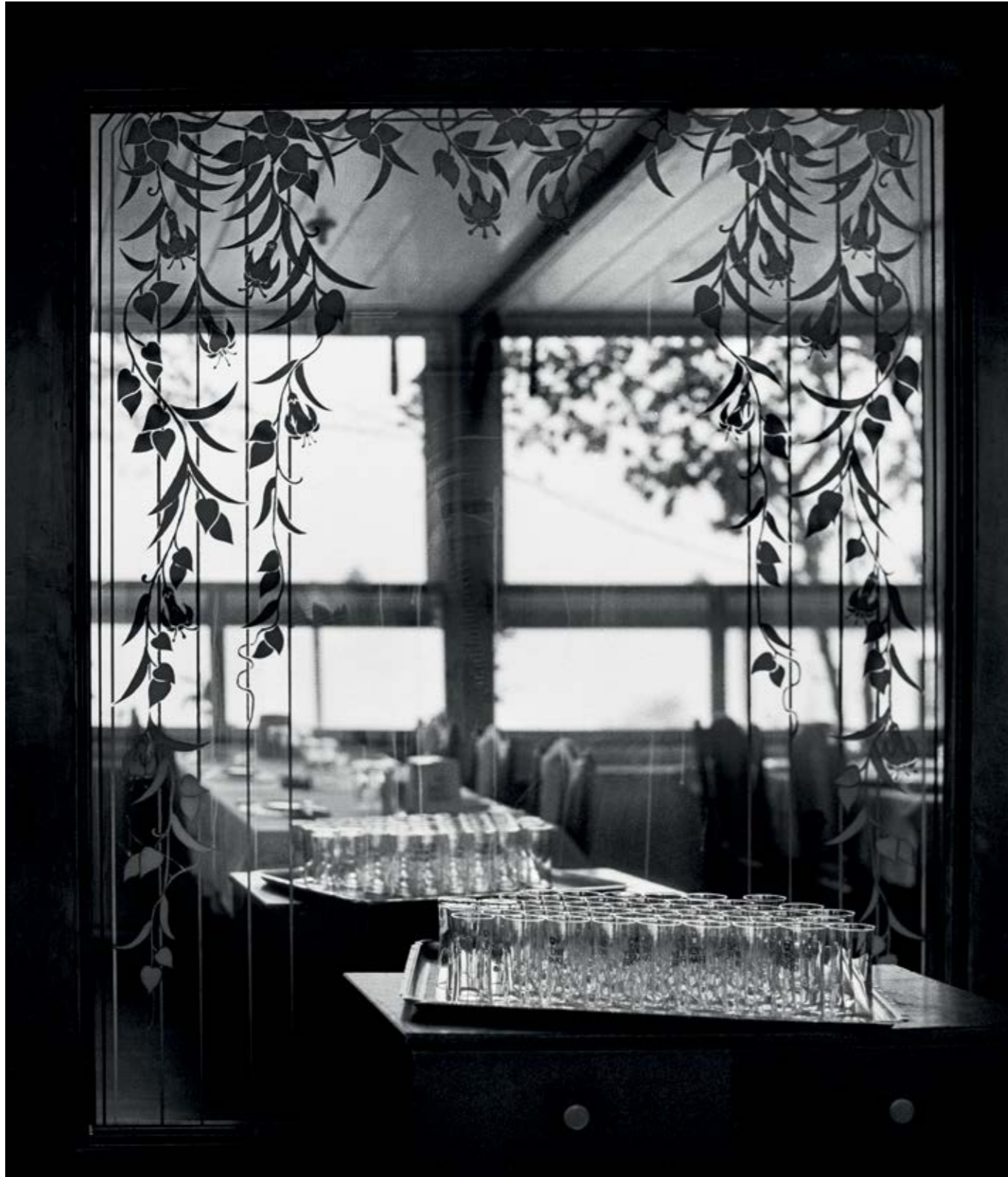
Hasan Deniz Fine Art Paper, 100x86 cm, 2012