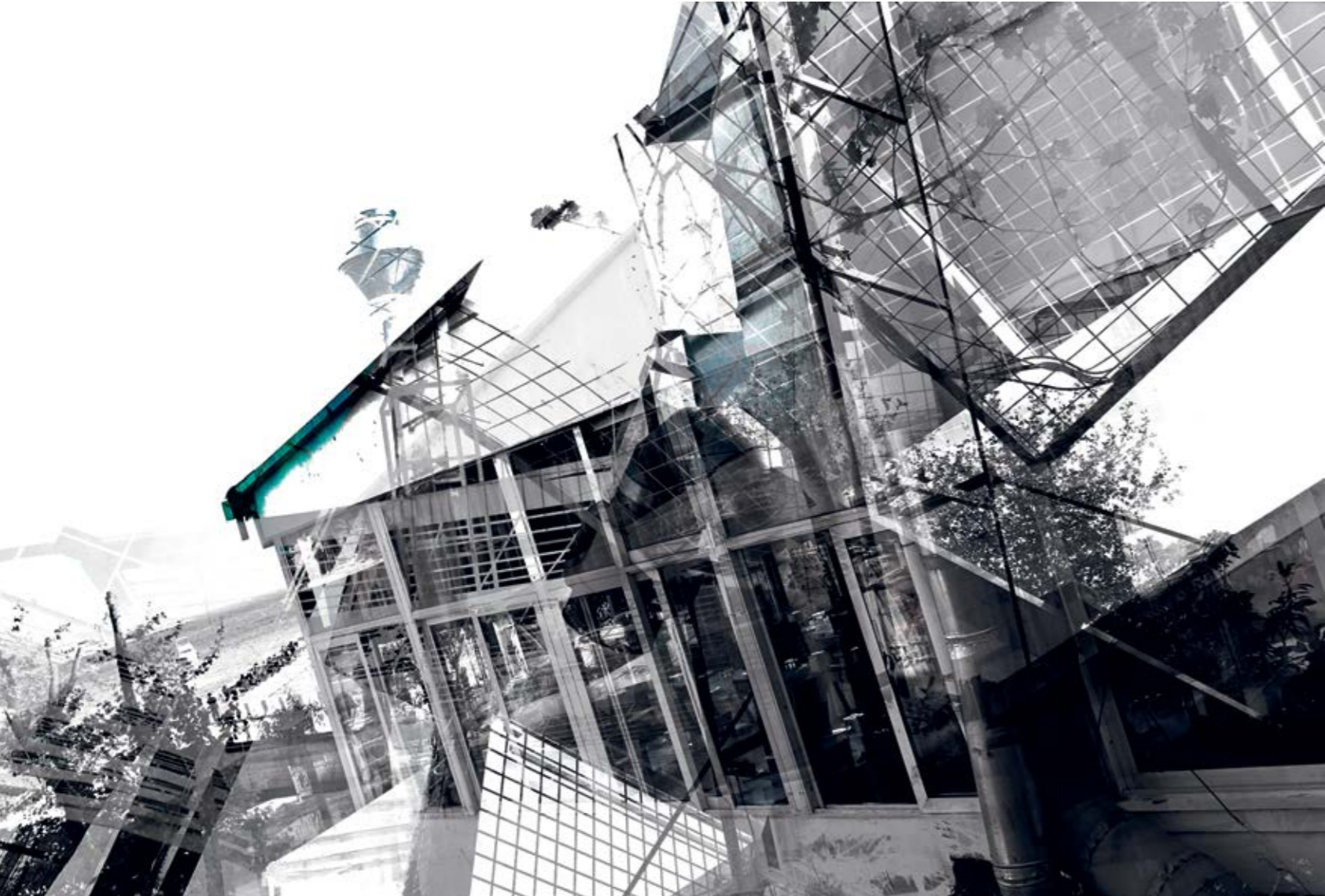
Burcu Aksoy "Saat 19.07", C - Print, 80x120 cm, 2012